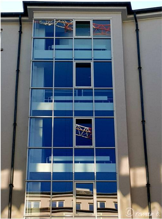
the missing piece