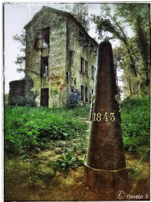
no un der Grenz