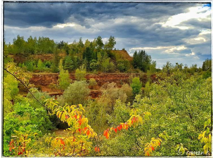
... um giele Botter