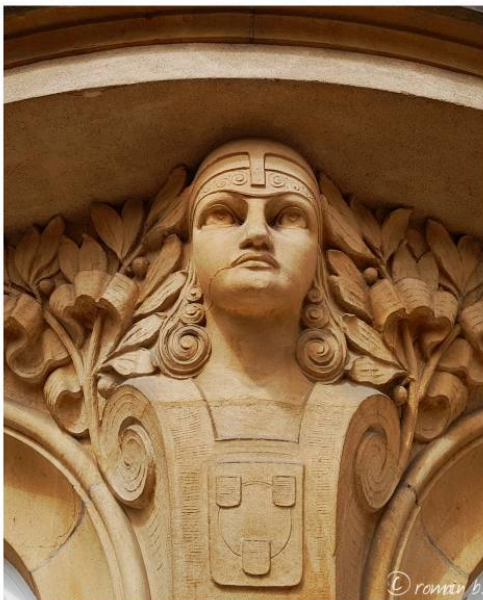
an der Stad